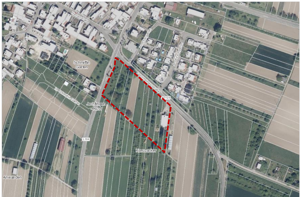
Luftbild mit hinterlegtem Kataster und schematischer Darstellung des Änderungsbereiches – rot-gestrichelte Umrandung (ohne Maßstab, genordet)

Der Änderungsbereich ist derzeit landwirtschaftlich durch Grünland, Ackerland und Streuobstbestände geprägt. Die am westlichen Gebietsrand gelegenen Grundstücke werden durch einen Weisweiler Handwerksbetrieb genutzt.